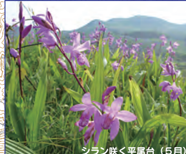
シラン咲く平尾台 (5月)