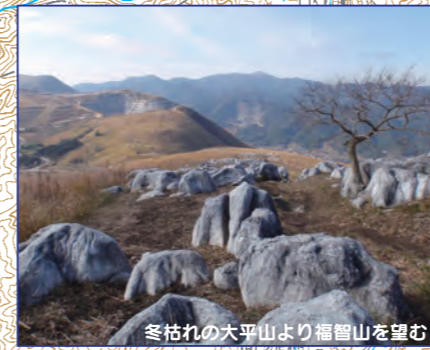
冬枯れの大平山より福智山を望む