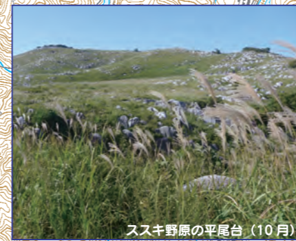
ススキ野原の平尾台 (10月)