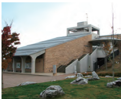
平尾台自然観察センター

平尾台自然の郷 ：モノづくりを体験できる工房のほか、キャンプ場などがあり、ファミリーで楽しめる施設が充実しています。